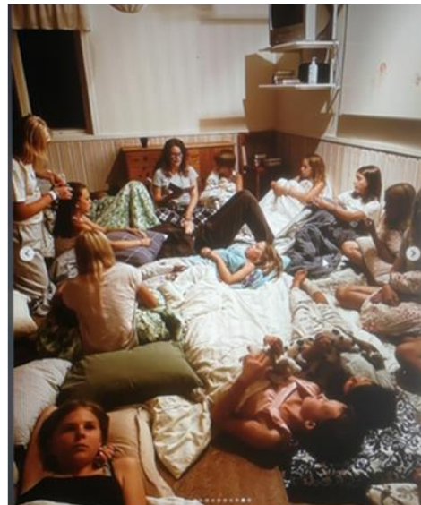
Go'nattsaga är aldrig fel!