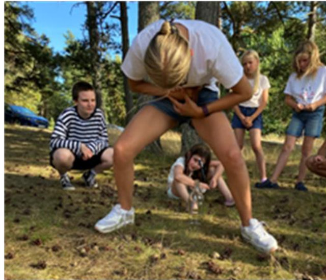
Penna i flaska – knepigt!