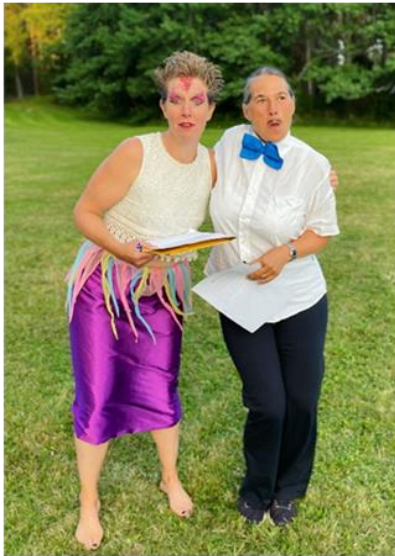
Ledare från främmande land?